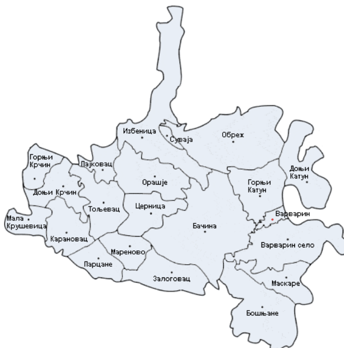
Слика бр. 2. Насеља у општини Варварин

Подручје општине Варварин простире се на североисточном делу Расинског округа и обухвата јужне и источне падине Јухора, југоисточне обронке Гледићских планина као и део алувијалне равни на левој обали Западне и Велике Мораве. Смештена на крајњем југу Горњовеликоморавске котлине, општина Варварин чини раскрсницу путева регионалног ранга који повезују јужну и северну Србију са крушевачким и краљевачким подручјем.